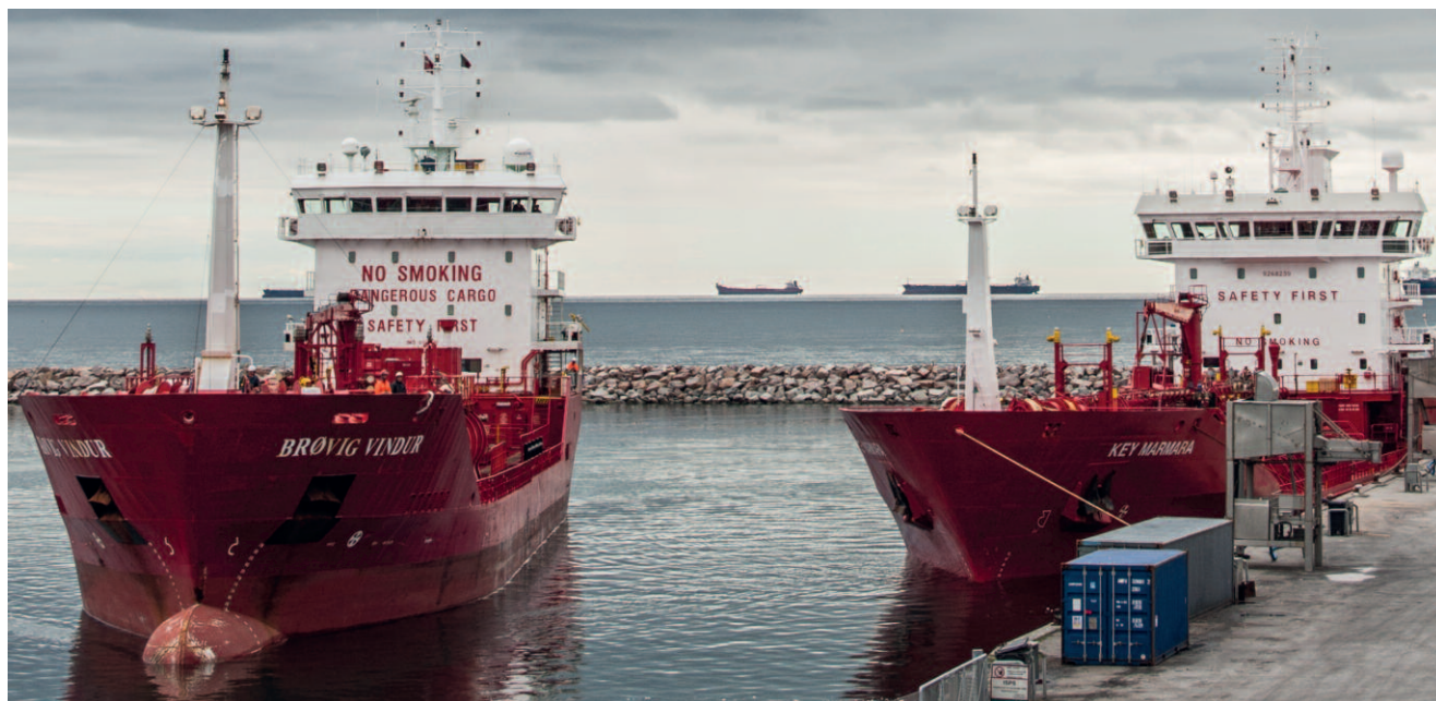
To olietankskibe, "Brøvig Vindur" og "Key Marmara" i Skagen Havn prægede dele af havnebilledet fornylig ved losning og lastning af fiskeolie.