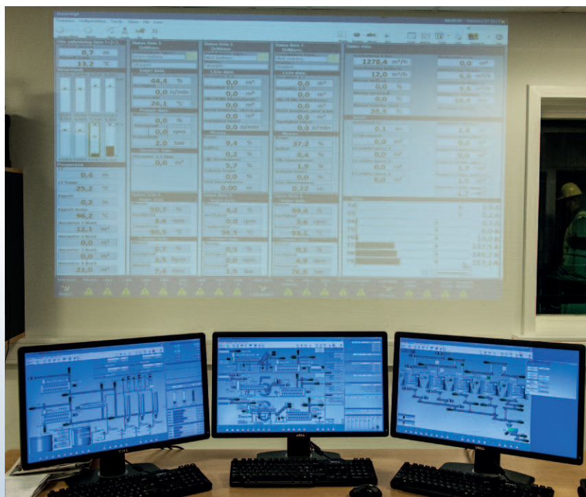
Alle losseanlæg overvåges ved et SRO-anlæg: Styring, Regulering og Overvågning.

Der står proteinfisk på entreprenørernes oplysninger om byggeriet på havnen. Det har de ikke selv valgt, men det har bygherren, FF Skagen A/S besluttet. Industrifisk er reelt proteinfisk. Det nye anlæg til råvarer er nemlig et vigtigt led fra fangst til forbruger, når den såkaldte industrifisk landes og "omdannes" til de proteiner, som indgår i kosten med produkter af fiskemel og fiskeolie til opdræt af svin, fjerkræ og opdrætsfisk.