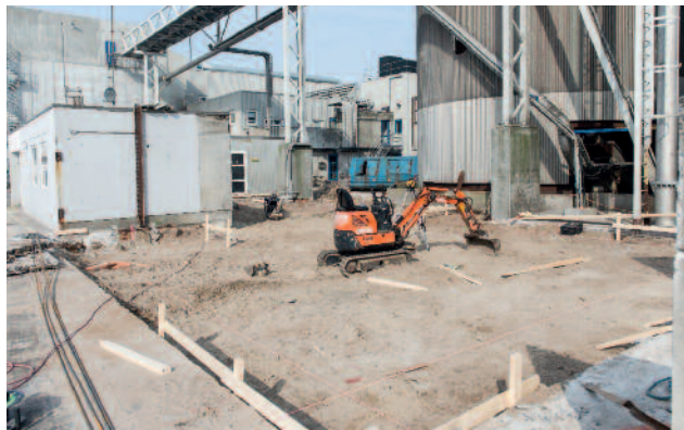
Arbejdet er i fuld gang med tilbygningen på 150 kvm., der giver kajfolk og lastoptagere optimale forhold

Tilbygningen på 150 kvm rejses ved kajkontoret. Der indrettes aflåste skabe til kajfolk og lastoptagere, som hver især kan få deres personlige værnemidler - det vil sige sikkerhedsudstyr og beklædning opbevaret i egne, ventilerede skabe.